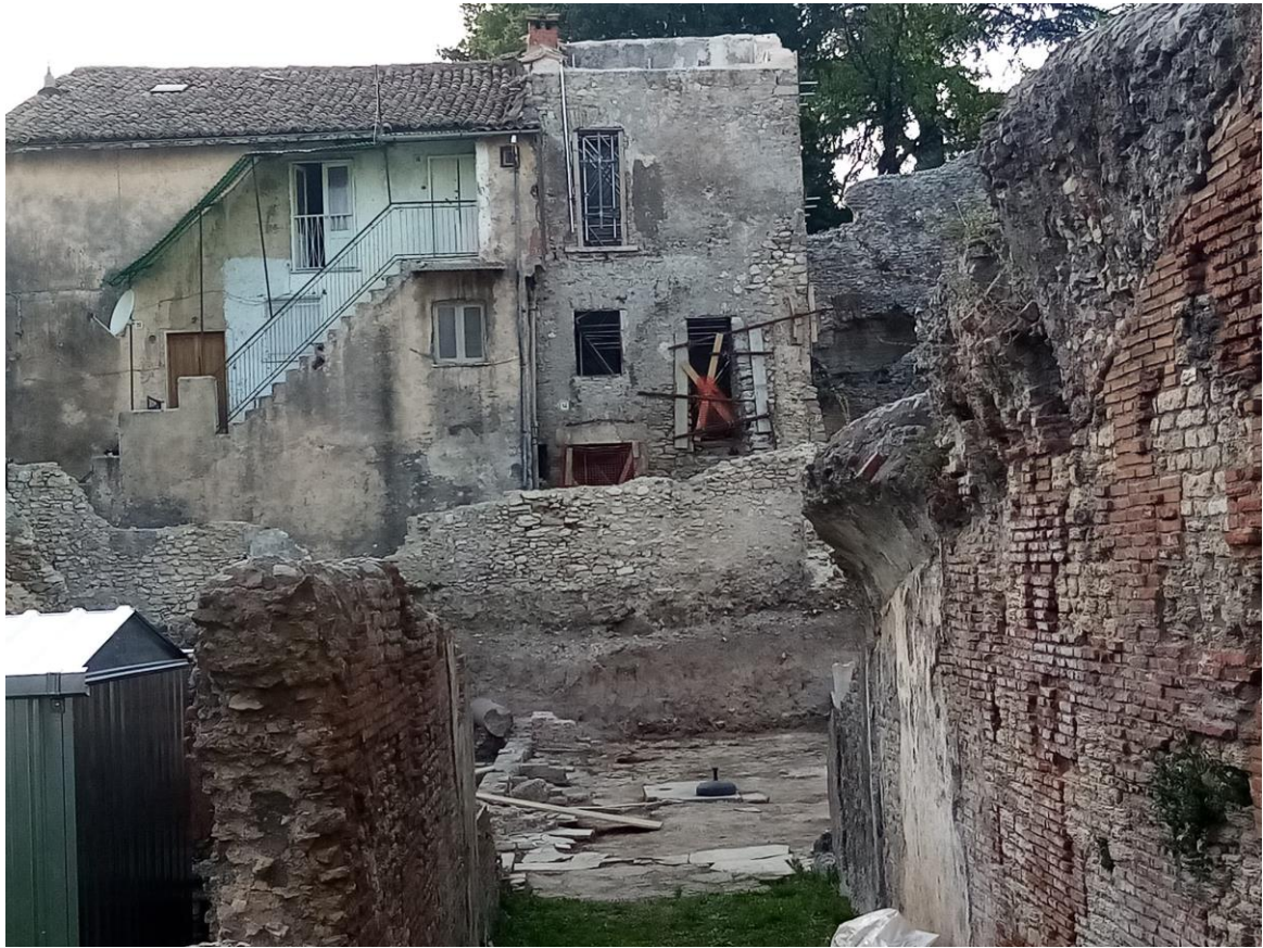
Teatro Romano, resti rinvenuti nei recenti scavi del 2022