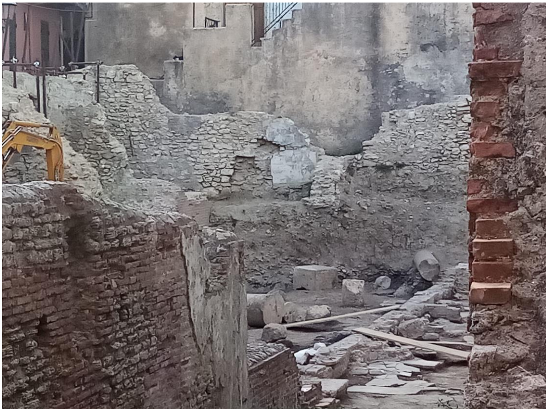
Teatro Romano, resti rinvenuti nei recenti scavi del 2022