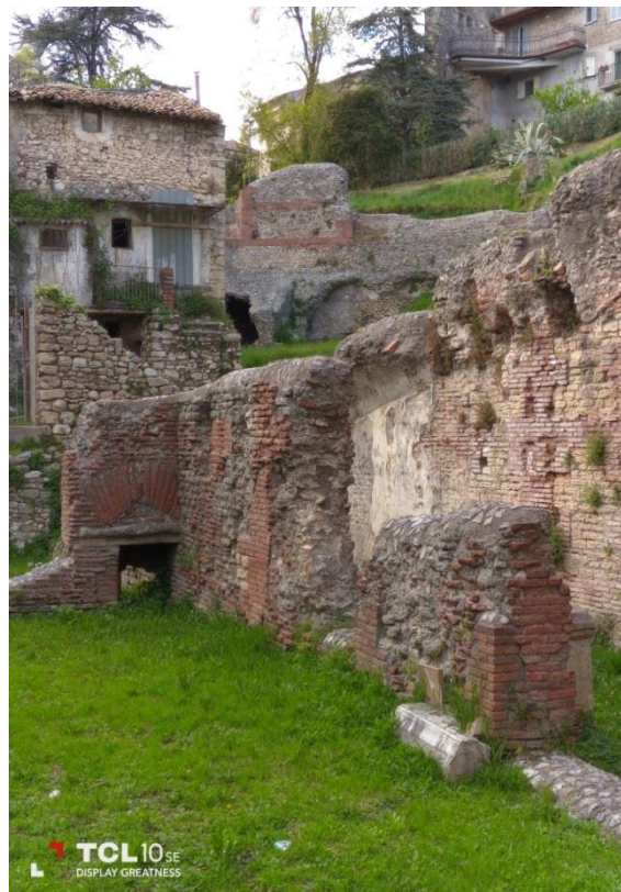
Teatro Romano, resti riportati alla luce negli anni '80-'90 del secolo scorso