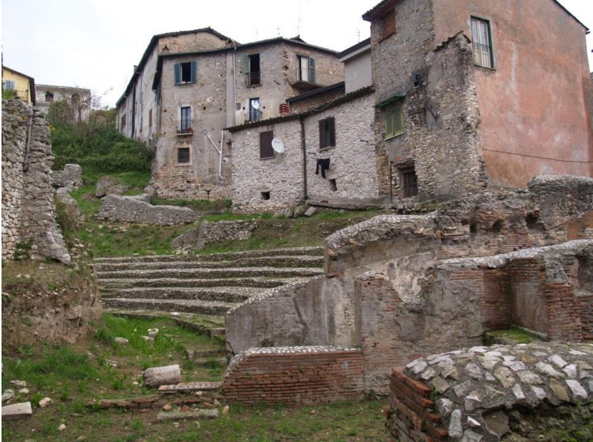
Teatro Romano, resti riportati alla luce negli anni '80-'90 del secolo scorso