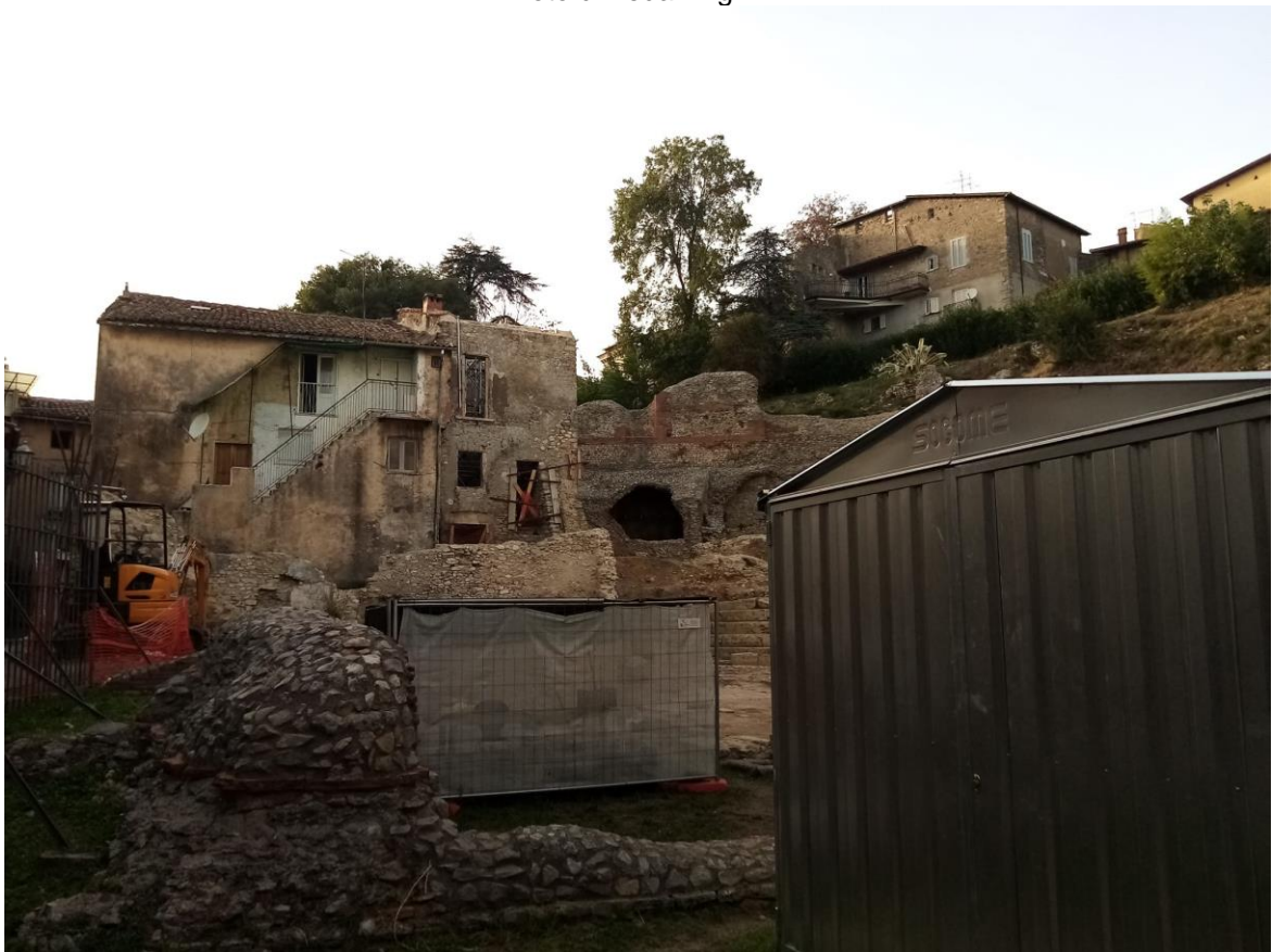
Teatro Romano, resti rinvenuti nei recenti scavi del 2022