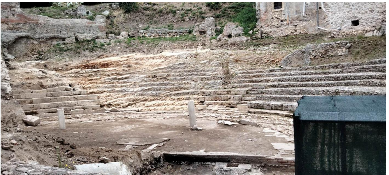
Teatro Romano, resti rinvenuti nei recenti scavi del 2022