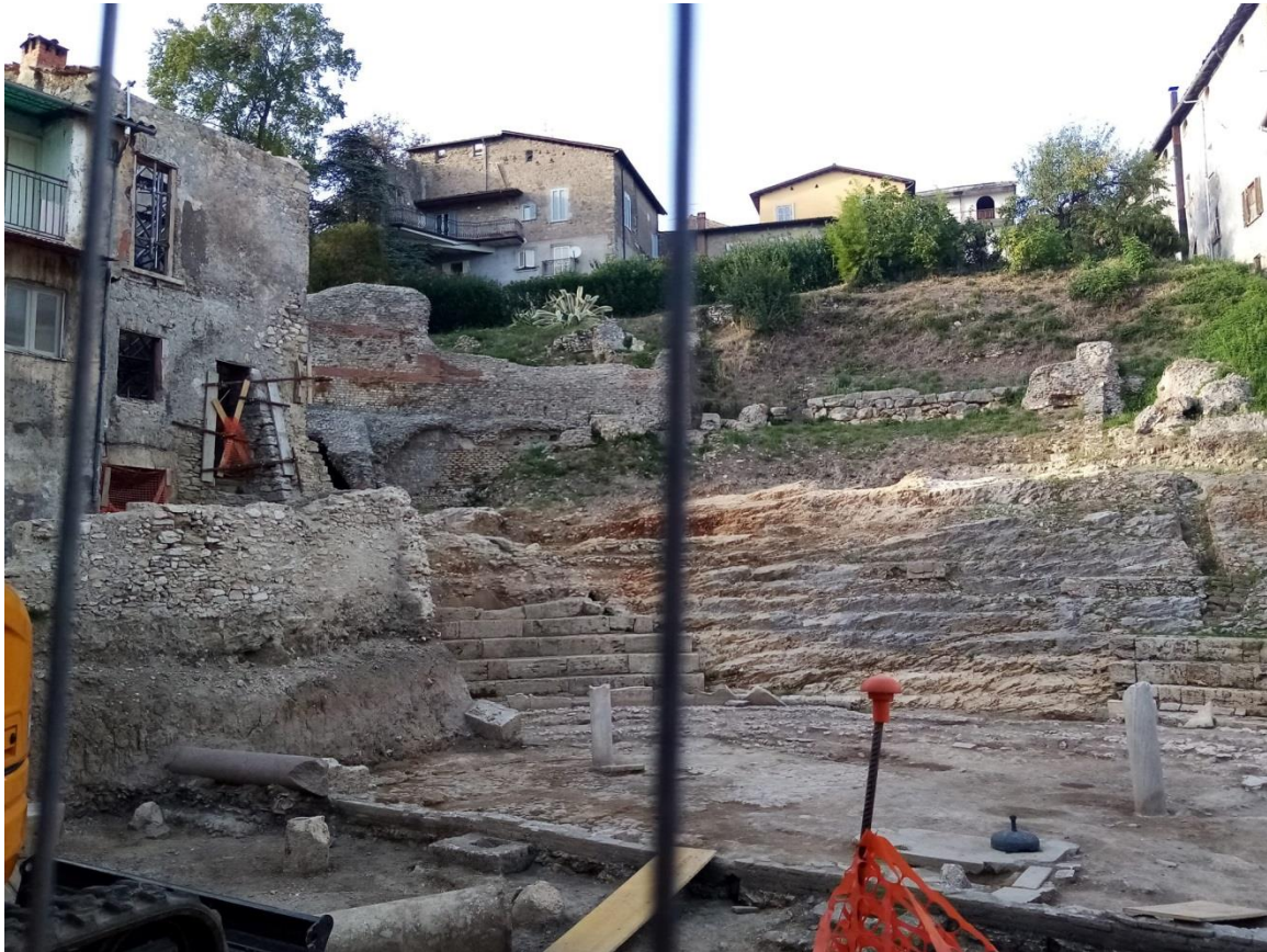
Teatro Romano, resti rinvenuti nei recenti scavi del 2022