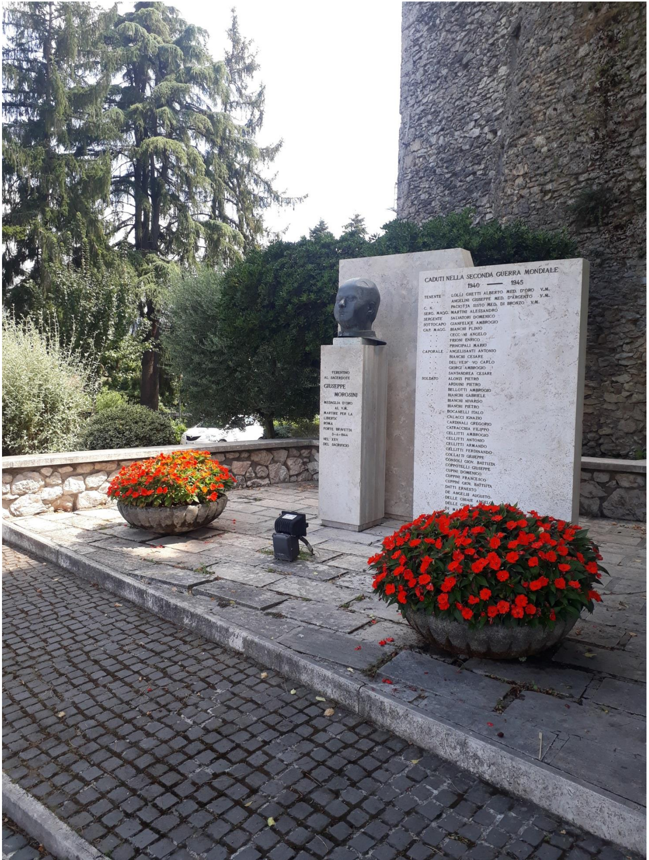
Ferentino, Via Guglielmo Marconi Monumento a Don Giuseppe Morosini, Alessandro Ciuffarella (1969)