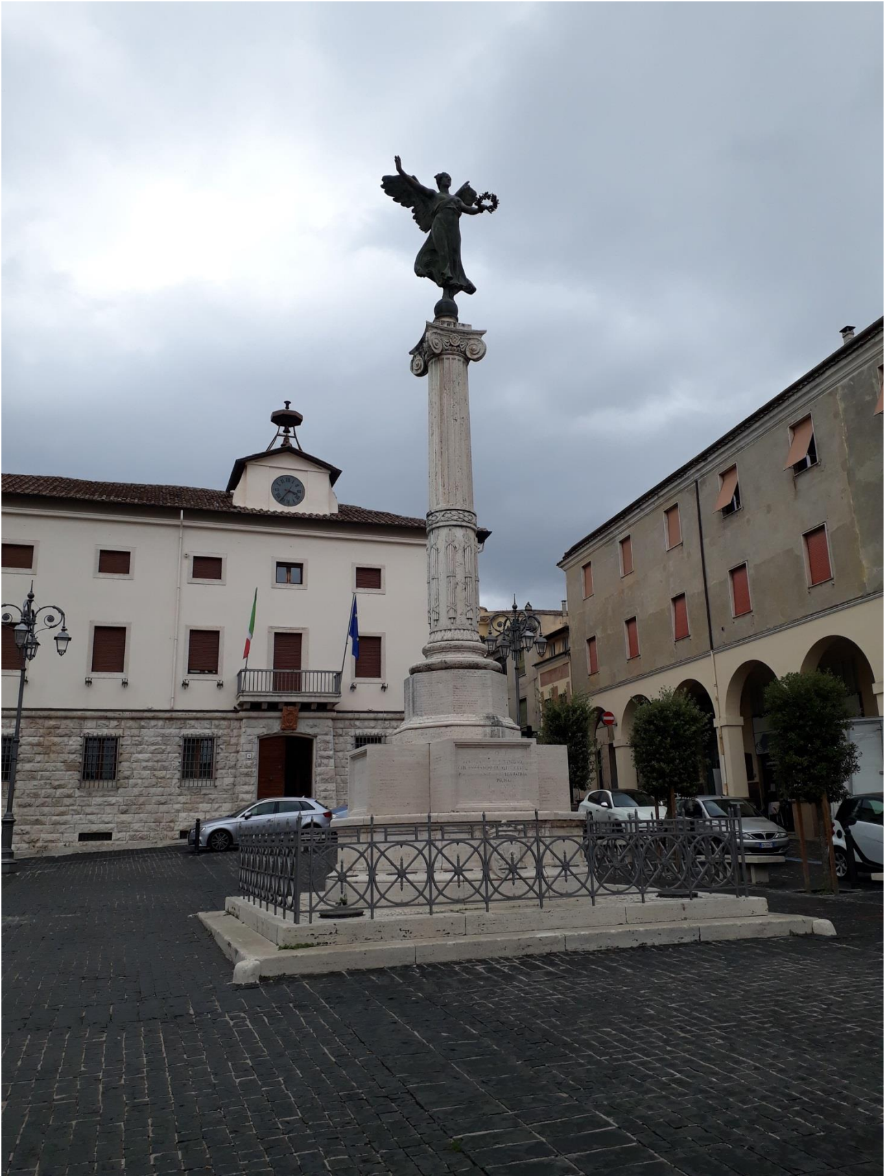
Ferentino, Piazza Matteotti, Monumento ai Caduti nella Prima Guerra Mondiale, arch. Luigi Morosini (1921)