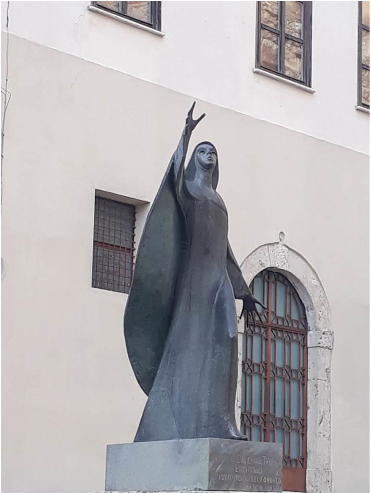
Ferentino, Via Caterina Troiani Statua di Madre Caterina Troiani, di Andrea Martini (1985)