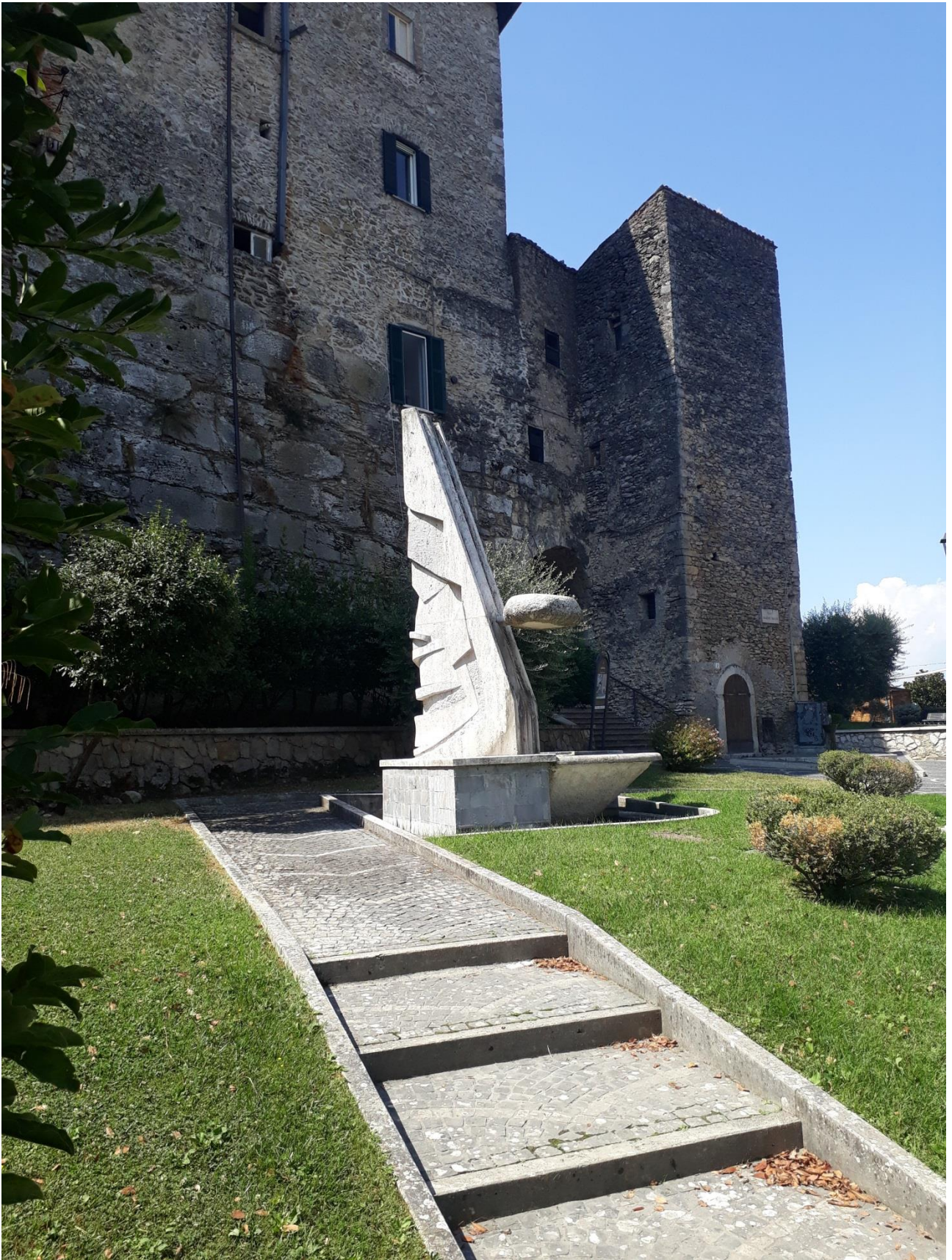
Ferentino, Via Guglielmo Marconi Fontana, opera di Vincenzo Ludovici (1986)