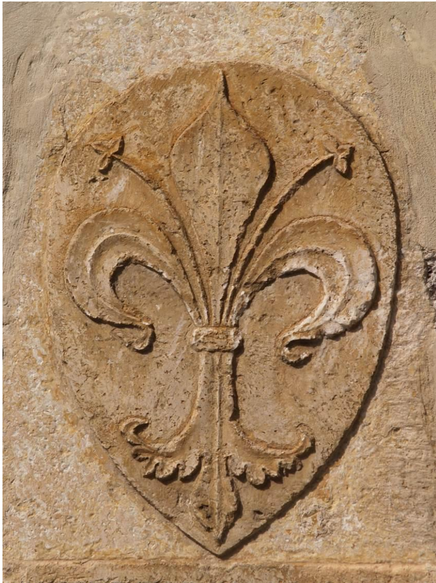
Lo Stemma di Ferentino Palazzo "Martino Filetico"

"... di rosso, al giglio d'argento ". Lo scudo deve essere sormontato dalla corona di città, perché i Comuni insigniti del titolo di Città devono utilizzare nello stemma una corona turrata, formata da un cerchio d'oro aperto da otto pusterle (cinque visibili) con due cordonate a muro sui margini, sostenente otto torri (cinque visibili), riunite da cortine di muro, il tutto d'oro e murato di nero.