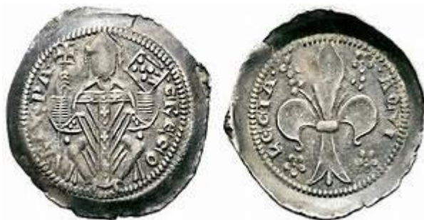
Denaro con grande giglio, Argento gr. 1,04

È interessante notare come Gregorio di Montelongo (figlio di Lando, nato a Ferentino nei primi anni del XIII secolo - morto l'8 settembre 1269 e sepolto nel duomo di Cividale), ferentinate e patriarca di Aquileia (dal 1251 al 1269), nella sua monetazione utilizza come stemma il giglio di Ferentino.